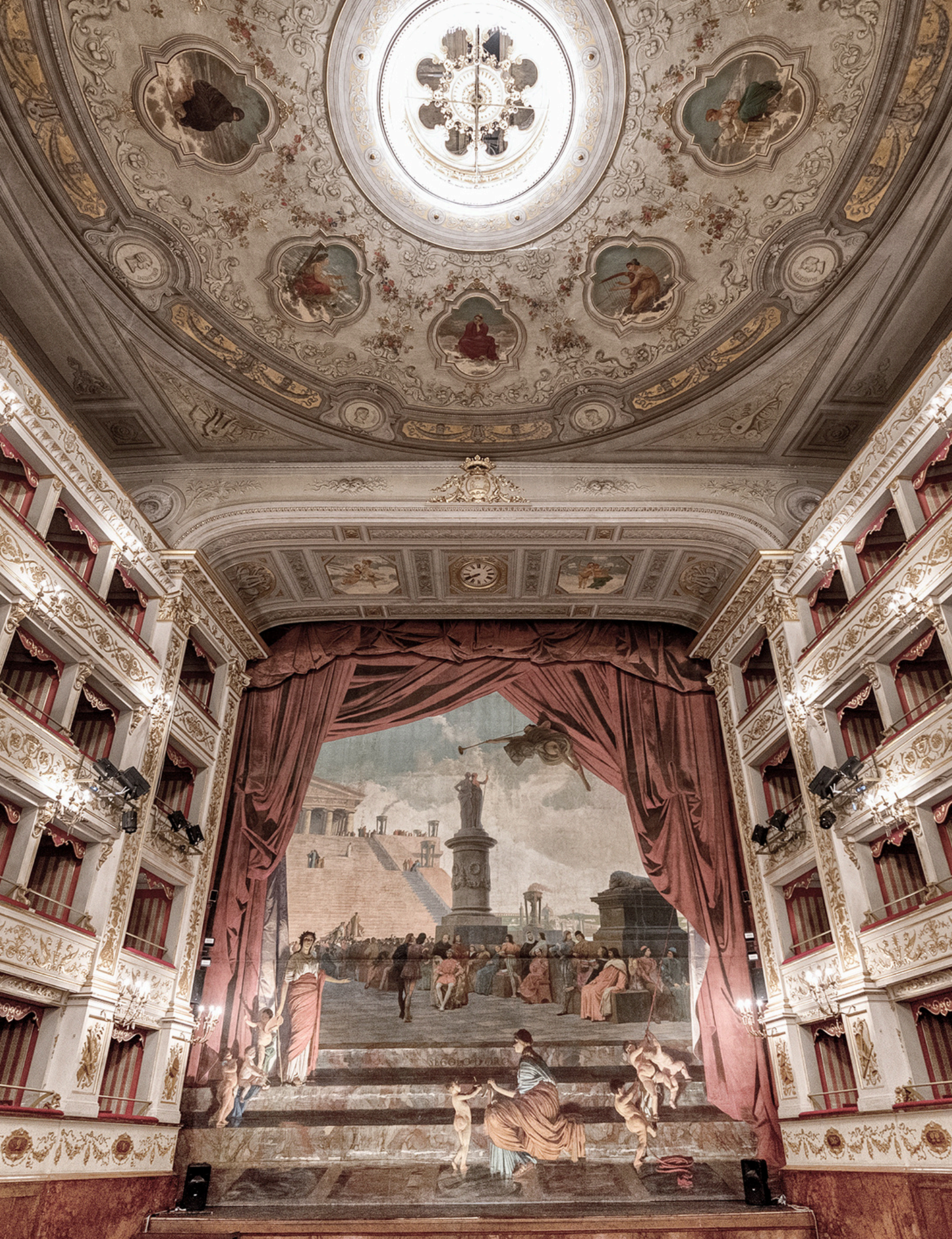
TEATRO GENTILE DA FABRIANO